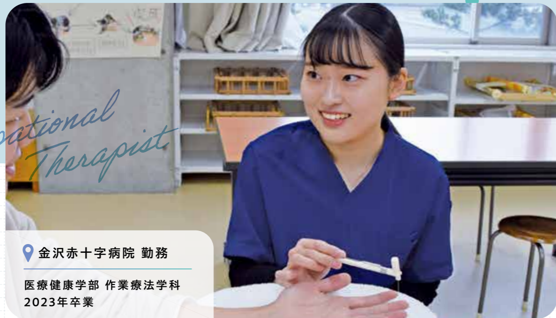
📍 金沢赤十字病院 勤務