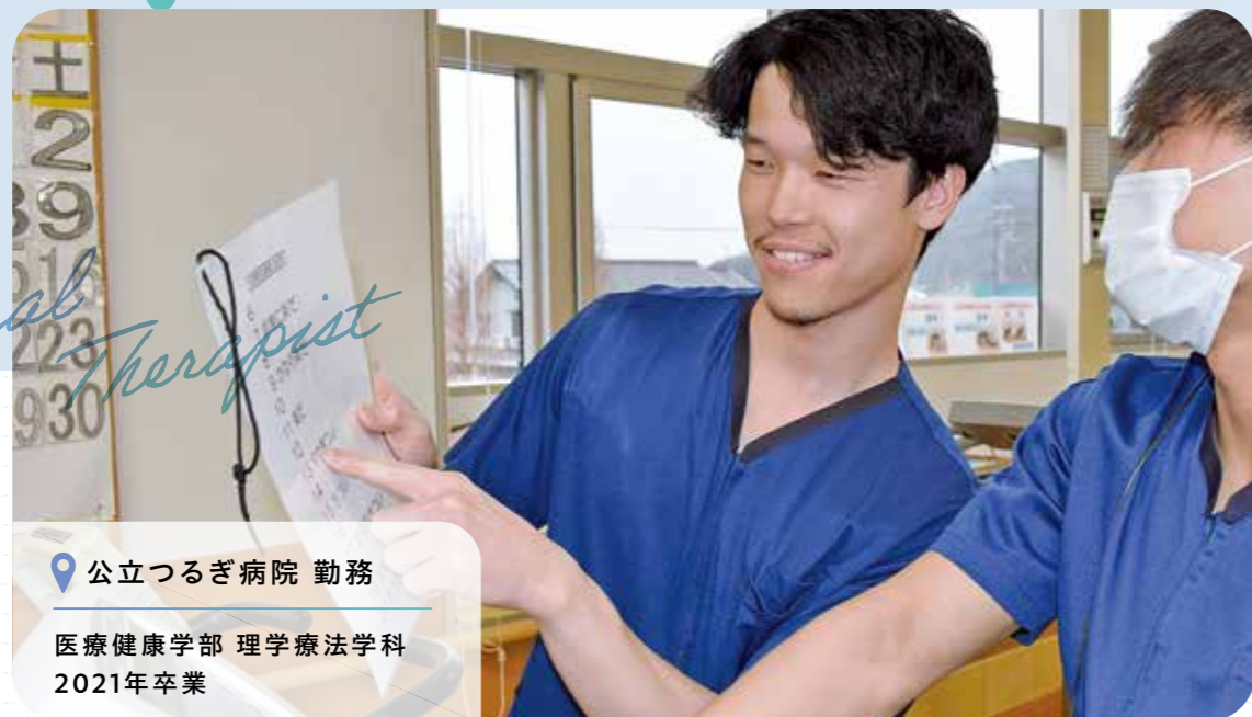
公立つぎ病院 勤務