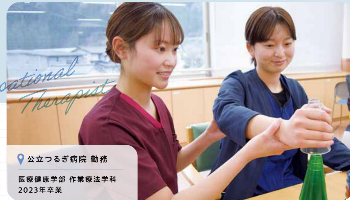
📍 公立つるぎ病院 勤務