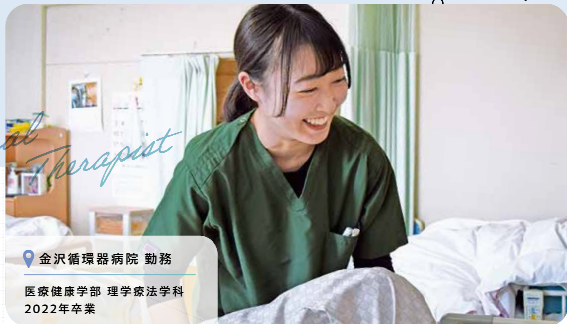
金沢循環器病院 勤務